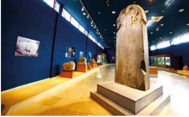
Moğolistan Höşöö Tsaydam Müzesi'ndeki Kültigin Yazıtı