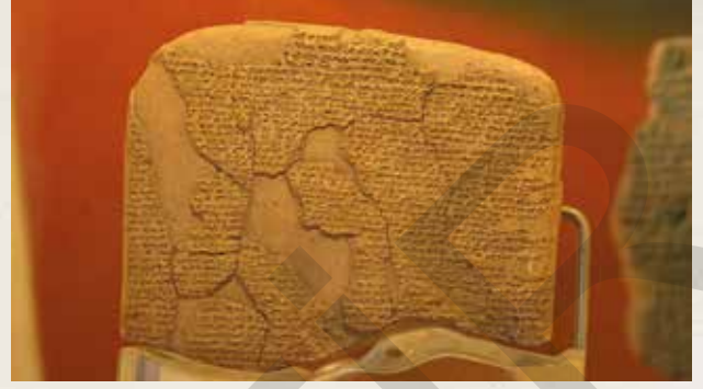
Kadeş Antlaşması tabletı